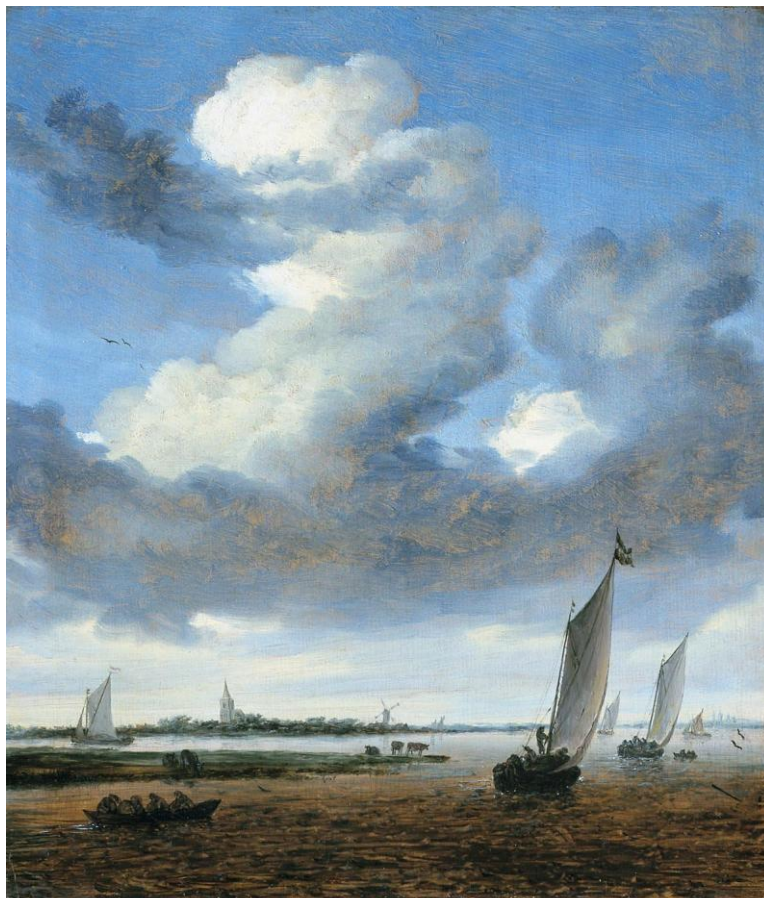
Gezicht op Beverwijk vanaf de Wijkermeer Salomon Ruysdael - 1661 (Mauritshuis)

Juni 2015 Westerhoutplein 1 1943 AA BEVERWIJK T: 0251-214507 E: mk@museumkennemerland.nl W: www.museumkennemerland.nl