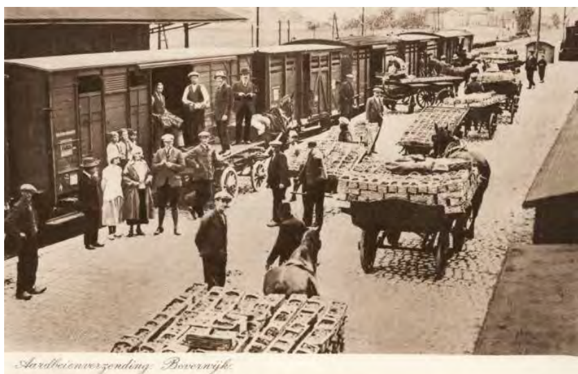
Station Beverwijk; verzending van een lading aardbeien | ca. 1930

Dankzij onze goede contacten met de pers zijn deze minitentoonstellingen uitvoerig in beeld geweest. Het heeft geresulteerd in een langlopende vaste rubriek in Dagblad Kennemerland die ook nog eens uniek nieuw materiaal oplevert.